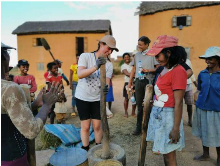
Découverte de la culture locale pour les jeunes à Madagascar.