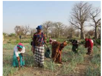
Les jardins maraichers au Sénégal améliorent la sécurité alimentaire des ménages.