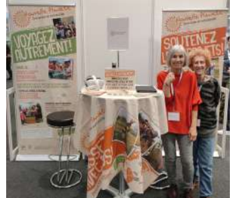
Stand d'info au Salon des Maturants à l'EPFL.