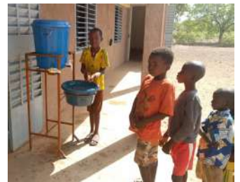
Eau, hygiène et assainissement au Burkina Faso.