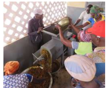
Au Bénin, les unités d'extraction d'huile valorisent les récoltes locales.