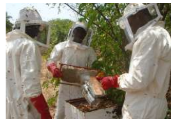
L'apiculture éco-responsable : un domaine encore largement sous-valorisé en Guinée.