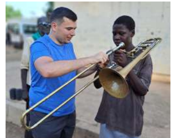
De jolis échanges autour de la musique ont eu lieu au Sénégal lors du voyage de la Landwehr.