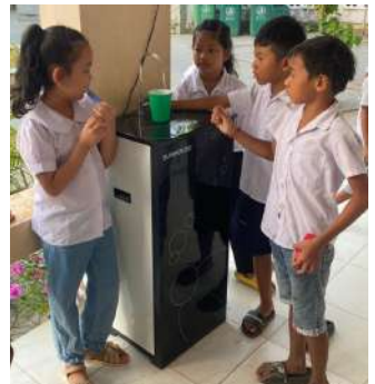
Accès à l'eau potable au Vietnam.