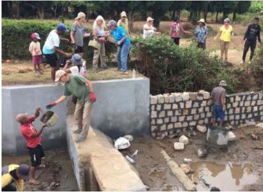
Collaboration entre Suisses et Malgaches sur le chantier.

Deux groupes d'un total de 19 adultes/seniors se sont rendus à Madagascar et au Sénégal. Ils ont eu tous deux un grand succès avec une note de 5,6 pour Madagascar et de 5,5 pour le Sénégal, malgré quelques défis durant les séjours.