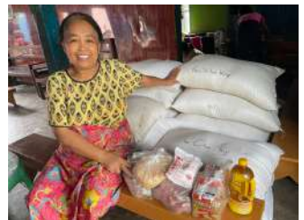
Projet d'aide alimentaire au Myanmar.