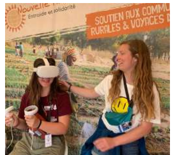
Casque de réalité virtuelle permettant de s'immerger dans la réalité de nos pays d'intervention