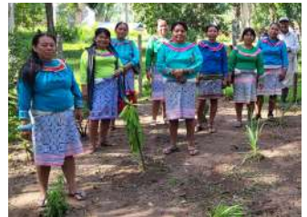
Aménagement de jardins de plantes médicinales au Pérou.