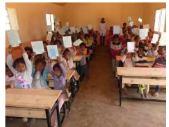
Améliorer l'éducation de base à Madagascar, un travail de longue haleine.