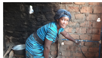
Projet de biogaz à Ntenjeru, Ouganda