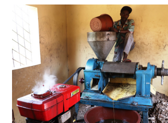
Unité de transformation 'huile de palme, à Dorneya, Guinée