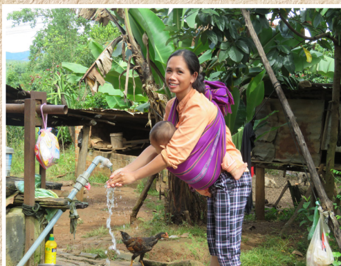
Pour l'autonomie et la satisfaction des bénéficiaires