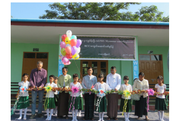
Inauguration de l'école de Let Pan Chaung, Myanmar-Birmanie

Vietnam: En 2018, nous avons soutenu deux écoles enfantines et la construction de cinq ponts piétons dans la province de Hau Giang. 1'400 habitants ont bénéficié de notre soutien. Nous allons progressivement orienter nos actions vers des zones où les besoins sont encore plus urgents. Nous prévoyons d'intervenir dans un nouveau district entièrement peuplé de minorités ethniques dans les montagnes du centre de pays, où le taux de pauvreté est particulièrement élevé.