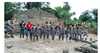
Guinée : Un groupe de la Sarraz a participé au projet d'unité de transformation de Manioc