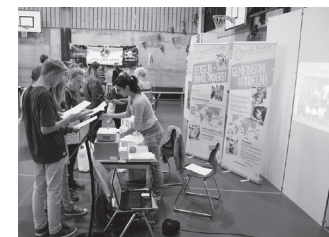
Notre stand à la manifestation Step into Action à Burgdorf