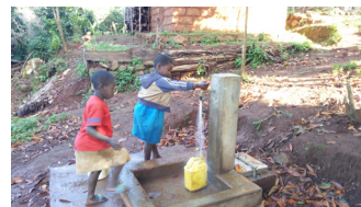
Adduction d'eau à Chuaku, Cameroun