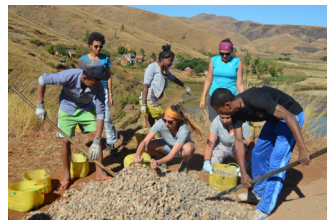
Madagascar : jeunes suisses allemands et malgaches travaillent main dans la main sur le projet d'adduction d'eau