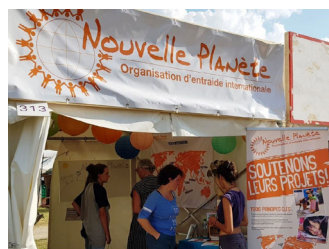
Un groupe de bénévoles sur notre stand à Paléo