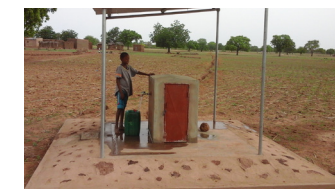
Borne fontaine à Siépa, Burkina Faso