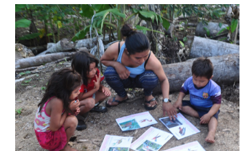
Enfants Matses au cours de lecture, Amazonie